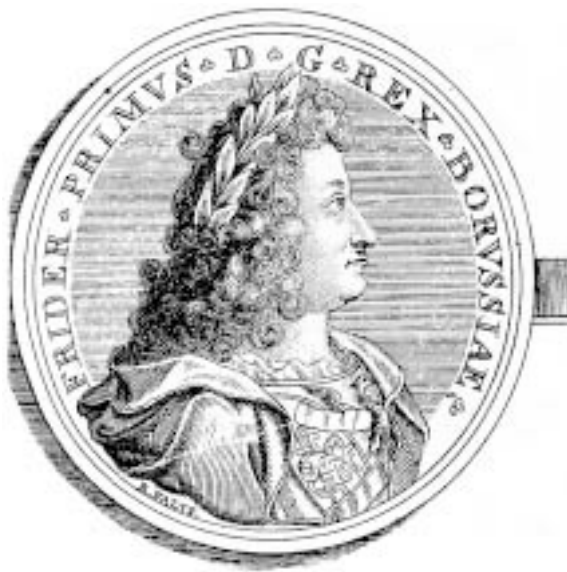
18. Januar 1701: Friedrich I. König in Preußen