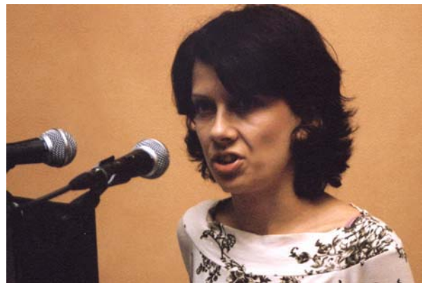
Die Referentin stellte im Rahmen eines Lichtbildervortrages einige der historischen Denkmalschutzobjekte Allensteins vor.

Für das Gebiet der Stadt Allenstein hat der Wojewode, entsprechend der Praxis in vielen anderen polnischen Städten, seine Kompetenzen an den Allensteiner Stadt-