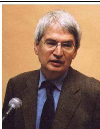
Dr. Rolf Derenbach Deutscher Landkreistag

Der Deutsche Landkreistag (DLT) ist der Dachverband der 323 Landkreise auf Bundesebene. Die unmittelbaren Mitglieder des DLT sind, dem föderalen Aufbau der Bundesrepublik Deutschland entsprechend, die Landkreistage in den Bundesländern. Gemeinsam mit den Städten und Gemeinden bilden die Kreise die kommunale Ebene. Der Verband der polnischen Kreise (Związek Powiatow Polskich) und der DLT arbeiten seit Beginn der 90er Jahre zusammen und sind im Jahre 1999 eine förmliche Verbandspartnerschaft eingegangen.