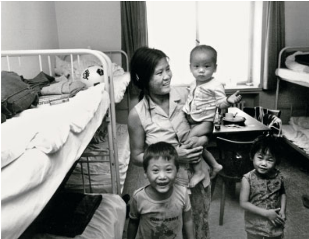
Vietnesin mit Kindern in der Außenstelle Bergkamen-Oberaden 1979

Im Frühjahr 1979 gründet der deutsche Journalist Rupert Neudeck zusammen mit Schriftstellern wie Heinrich Böll in Troisdorf bei Köln das private Hilfskomitee „Ein Schiff für Vietnam“. Sie möchten, nach dem Vorbild eines französischen Hilfsschiffes, dem Sterben und Ertrinken im Chinesischen Meer ein Ende machen. Die deutsche Bevölkerung lässt sich