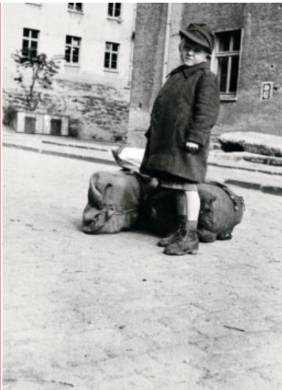
Ankunft am Wellersberg.

„Swallowtransporte. Unter diesem Namen liefen die traurigsten Bewegungen von Ost nach West. In wenigen Stunden und mit dürftigstem Gepäck mußten Menschen ihre Heimat verlassen und trafen, in Güterzüge gesperrt, von Miliz gefilzt und gepeinigt, erst nach vielen Tagen in Siegen ein. Verschmutzt, verlaust, ausgehungert.“