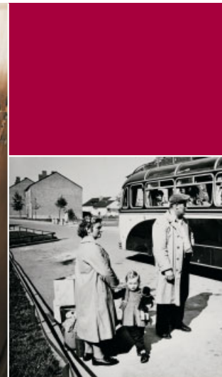
Ankunft im Lager Massen.