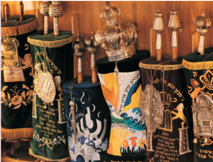
Thorarollen in der Dortmunder Synagoge.

Die Landesstelle Unna-Massen hat im Zeitraum von 1991 bis 2007 insgesamt 50.419 jüdische Zuwanderer aufgenommen.