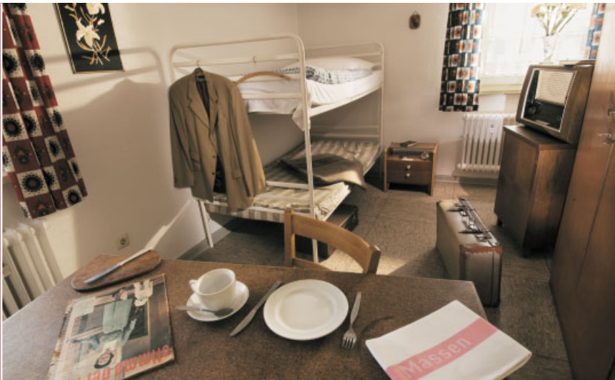
Nachgestellte Flüchtlingsunterkunft im Dokumentationszentrum der Landesstelle.

Sie sind körperlich geschwächt und mit seelischen Problemen belastet, die ihre Umgebung kaum nachvollziehen kann. Andere haben ihre Familien verloren und stehen ohne Ziel und Unterkunft auf der Straße, oder ihr Platz in der Familie ist von jemand anderem „besetzt“.