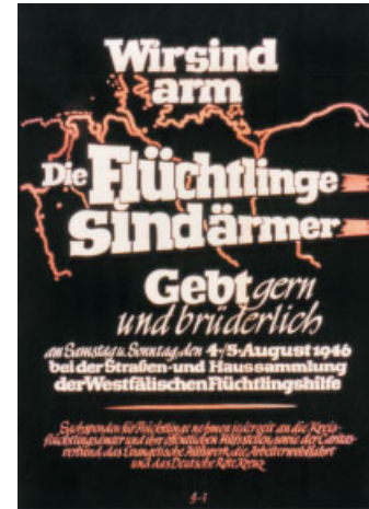
Plakat einer Straßensammlung für Flüchtlinge in Westfalen im August 1946.

In Siegen wird die ehemalige Kaserne am Wellersberg notdürftig als Hauptdurchgangslager für die Provinz Westfalen hergerichtet. Stadt und Kaserne sind stark beschädigt, ausschlaggebend für die Standortwahl ist die günstige Lage