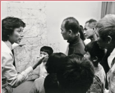
Der Dolmetscher in Bergkamen-Oberaden.

Nach öffentlichen Protesten kann die Hilfsaktion noch bis 1986 fortgeführt werden. Zwischen 1979 bis 1986 wird die Cap Anamur zur Rettung für 10.375 Menschen. Die meisten der Flüchtlinge leben noch heute in Deutschland, viele dürfen im Laufe der Jahre ihre Familienangehörigen nachholen.