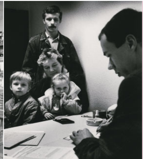
Beratung einer Aussiedlerfamilie.