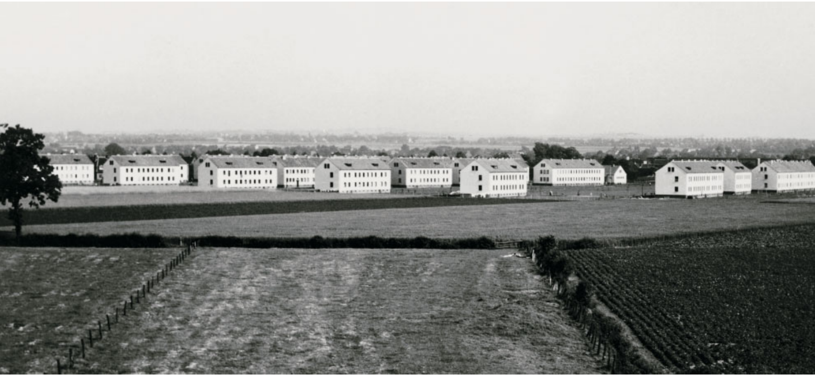
Hauptdurchgangslager Unna-Massen, Ausdehnung nach Beendigung des ersten Bauabschnittes 1951.