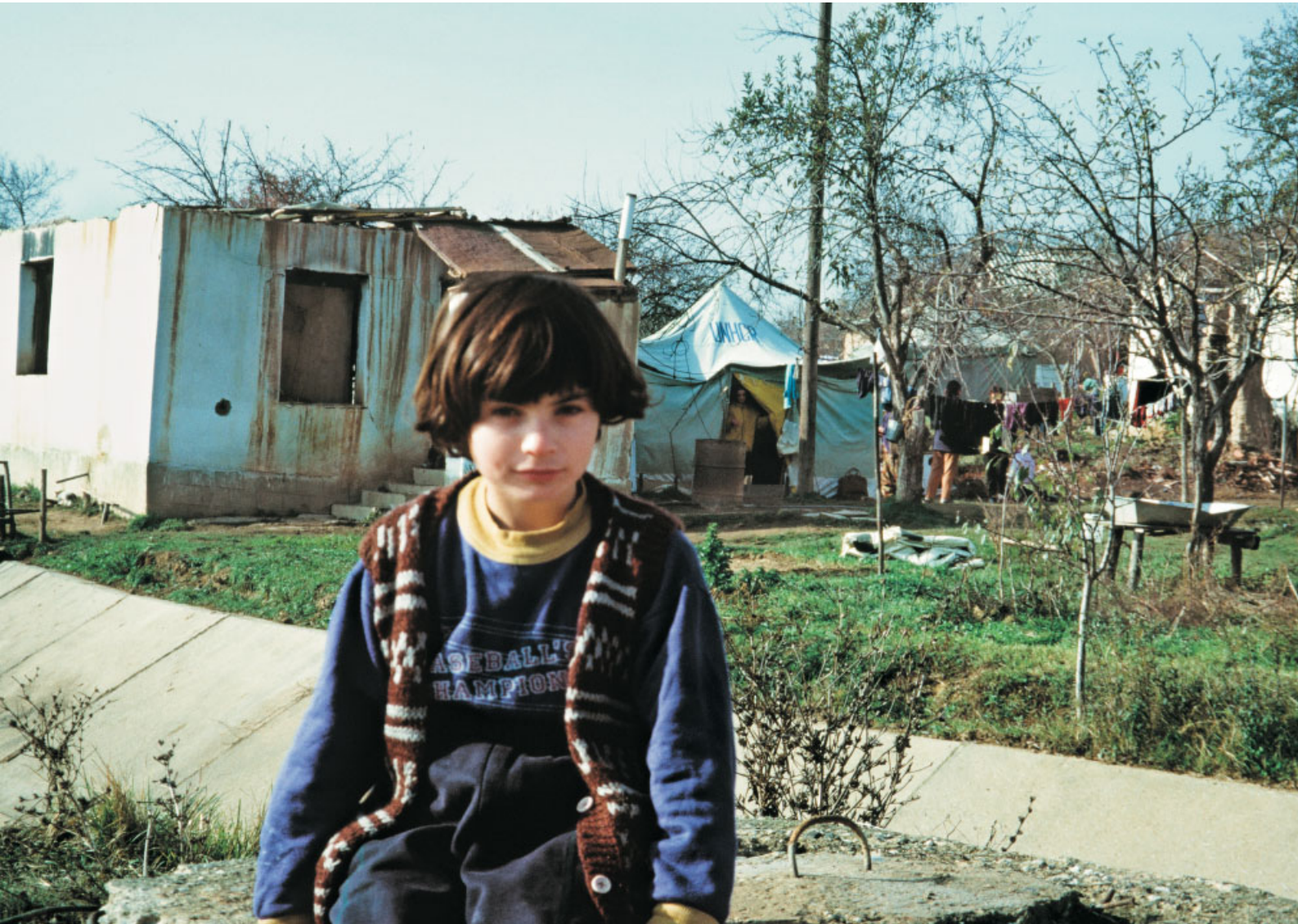
Zurück aus Unna im Kosovo. Im Hintergrund das ausgebrannte Haus. Die Familie lebt in dem blauen Flüchtlingszelt, eine Spende des UNHCR. Die Caritas aus der Landesstelle liefert per LKW den Hausrat aus Spenden.