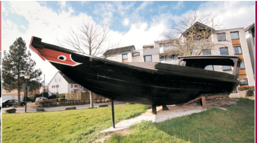
Gestrandet in Troisdorf. Das letzte Flüchtlingsboot, das Ende April 1982 im südchinesischen Meer von der Cap Anamur mit 52 vietnamesischen Flüchtlingen aufgefunden wurde .