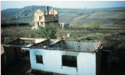
Ausgebrannte Häuser im Kosovo.

Die Kosovaren wollen aber nicht nur nehmen, sie beteiligen sich an der Organisation ihres Aufenthaltes in der Landesstelle. Mit Hilfe der Bundeswehr werden aus Prizren Schulbücher eingeflogen und die Akademiker unter den Flüchtlingen unterrichten in der Gerhart-Hauptmann-Schule. Kosovarische Künstler veranstalten eine Ausstellung und zum Dank bemalen sie in einer gemeinsamen Aktion mit Deutschen die Giebelwand eines Hauses in der Ruhrstraße. Motiv ist eine stilisierte Landschaft, über der ein weißer Engel mit einem Spruchband schwebt. „Unna 1999 Kosova“ lautet die Beschriftung.