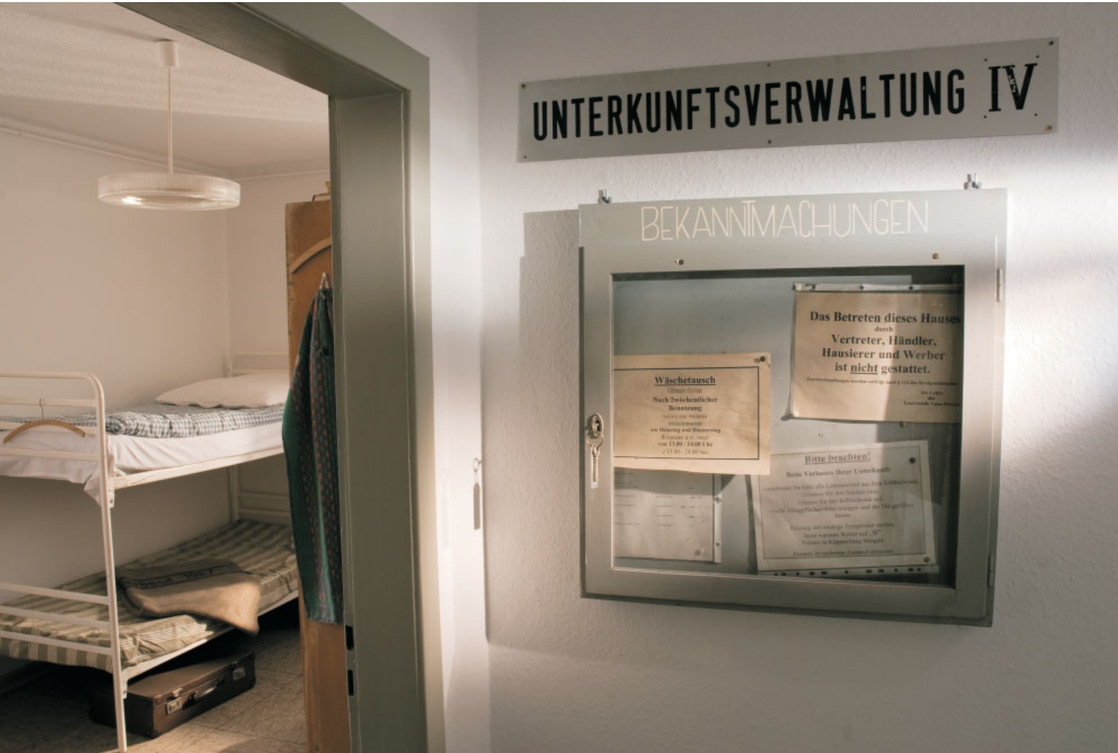
Nachgestellte Unterkunft im Dokumentationszentrum Unna-Massen, Ruhrstraße.