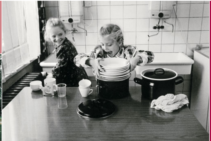
Spülende Mädchen aus Kasachstan in der Lagerunterkunft, 1990er Jahre.