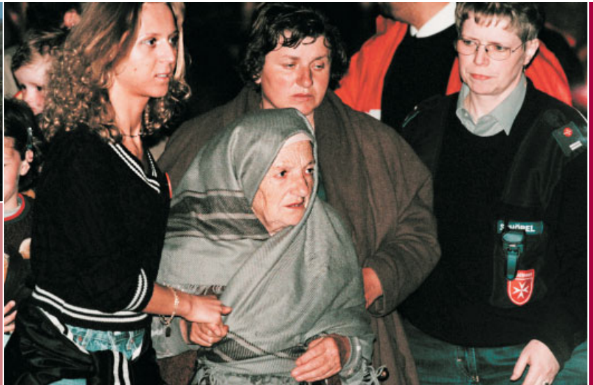
Erschöpft und gezeichnet von den Erlebnissen der letzten Tage. Ankunft der Flüchtlinge aus dem Kosovo in der Landesstelle.