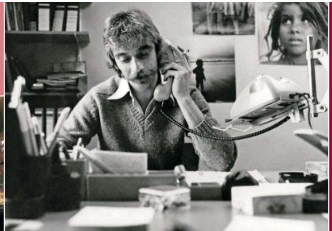
Büro der Landesstelle in den 1980ern.