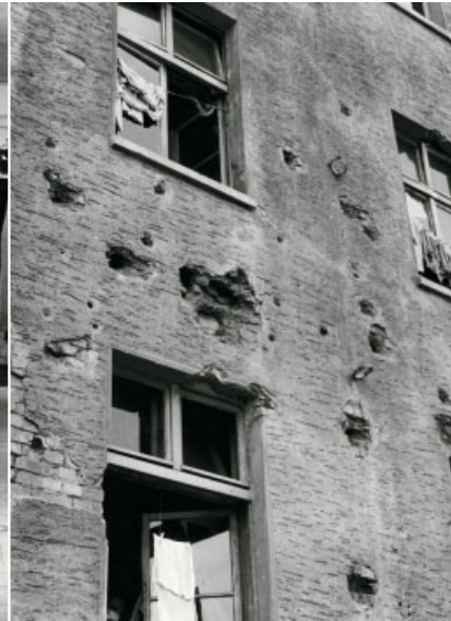
Vom Krieg gezeichnet. Kasernen-Gebäude am Wellersberg.