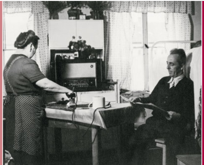
Lager Massen im September 1954. Eintrag von Deutschen aus Rumänien in die Lob- und Beschwerdebücher.

„Wir wandern schon vierzehn Jahre umher und finden keine Heimat mehr. Nach sieben Monate und eine Woche Aufenthalt im Lager Massen wollen wir Abschied nehmen und nach Neheim Hüsten weiterziehen um dort endlich unsere neue Heimat zu finden.“