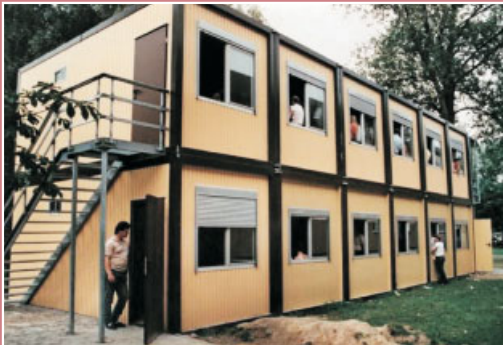
Container auf dem Gelände der Landesstelle, 1990er Jahre.

Die Landesstelle Unna-Massen nimmt im Zeitraum von 1976 bis 2007 insgesamt 539.382 Spätaussiedler aus der ehemaligen Sowjetunion auf. Darunter vor allem Familienverbände mit vielen jungen Menschen.