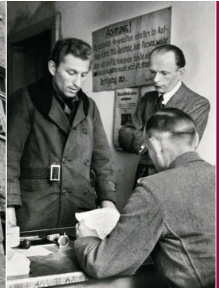
Registrierung der Flüchtlinge.