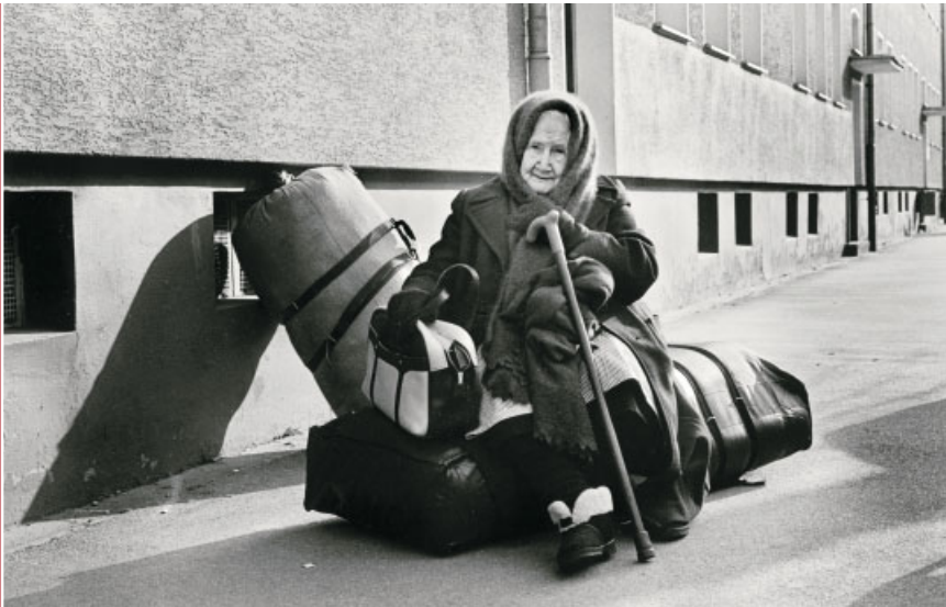
Vor der Unterkunft in Unna-Massen. Auch die Großmutter ist von Kasachstan mit nach Deutschland gekommen.

Aussiedleraufnahmegesetz tritt in Kraft. Ab sofort dürfen Aufnahmeanträge nur noch vom Herkunftsland ausgestellt werden. In Folge weiterer rechtlicher Änderungen sinken die Zugänge bei Spätaussiedlern.