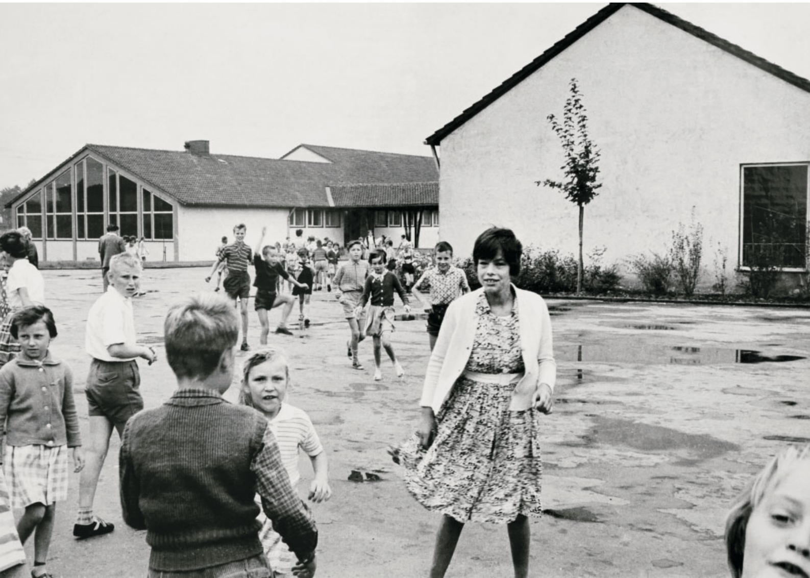
Auf dem Schulhof der Gerhart-Hauptmann-Schule.