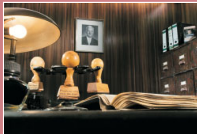
Nachgestelltes Büro aus den 1960ern im Dokumentationszentrum Unna-Massen.

Von linken Gruppen euphorisch begrüßt, von Rechten beschimpft, und von Vertriebenenvertretern als „Volksfrontchilenen“ abgelehnt. Die Aufnahme der Chile-Flüchtlinge polarisiert.