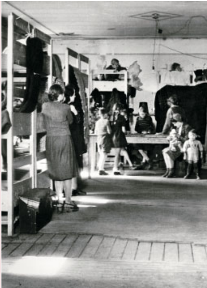
Dreistöckige Holzbetten in den Unterkünften.

Die Konflikte in und um das Durchgangslager am Wellersberg bewegen das nordrhein-westfälische Sozialministerium 1951 dazu, in Unna-Massen mit einem neuen Konzept Flüchtlingsbetreuung zu organisieren.