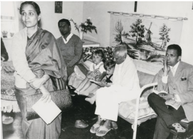
Eine indische Regierungsdelegation besichtigt 1962 das Modelllager Unna-Massen.

Von der Öffentlichkeit besonders wahrgenommen werden in den 1970er Jahren die Chile-Flüchtlinge bzw. die Boat People und die Flüchtlinge aus dem Balkan in den 1990ern.