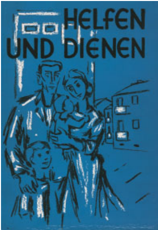
Titel der Chronik der Landesstelle aus dem Jahr 1959.

Während des Krieges leben etwa 10 Millionen Deutsche in den ehemaligen deutschen Ostgebieten (Ostpreußen, Pommern, Nieder- und Oberschlesien, Ostbrandenburg, Danzig und andere Gebiete). Nach Kriegsende müssen zwischen 1945 und 1950 ca. 3,6 Millionen Deutsche aus Polen sowie aus Ostdeutschland fliehen oder werden vertrieben. Hunderttausende finden dabei den Tod.