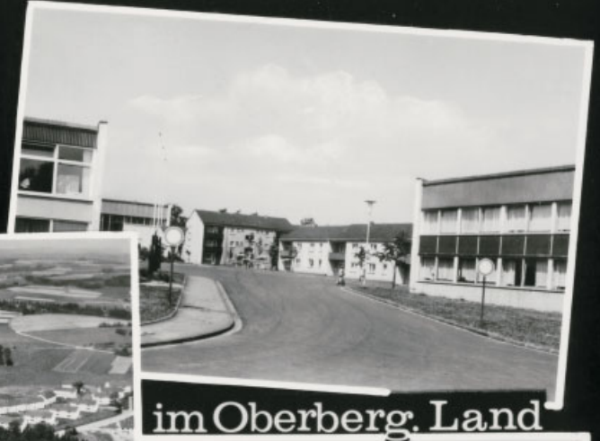
im Oberberg. Land